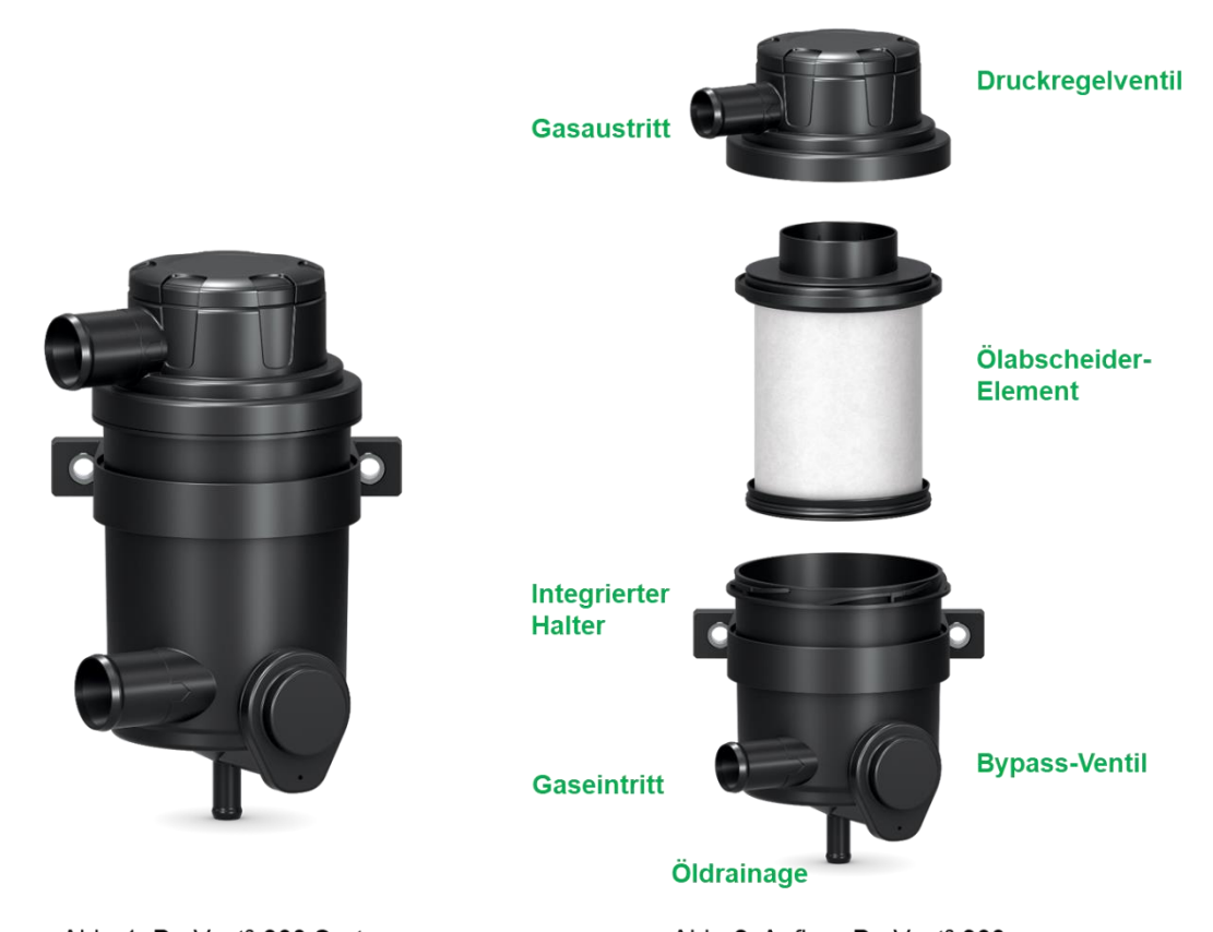
Abb. 1: ProVent<sup>2</sup> 300 System

ProVent<sup>2</sup> 300 Systeme sind sowohl für die Erstausrüstung als auch für die Nachrüstung konzipiert. Nachfolgende Abbildungen zeigen mögliche Aufbauten sowie ein Querschnitt des Systems.